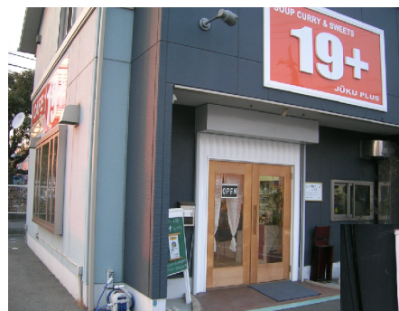
19種類のスパイス達