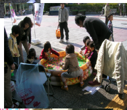
子供は風の子、元気な子」ですね！！